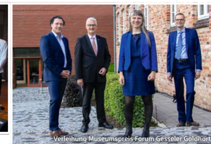
Verleihung Museumspreis Forum Gessler Goldhort