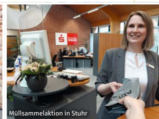
Müllsammelaktion in Stuhr