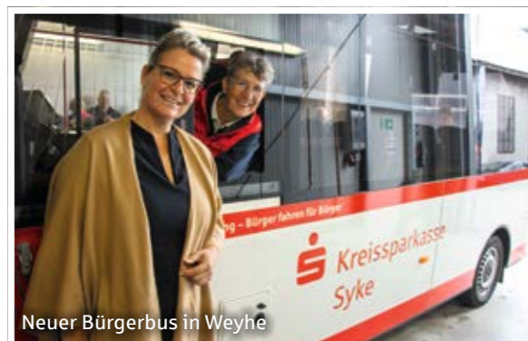
Neuer Bürgerbus in Weyhe