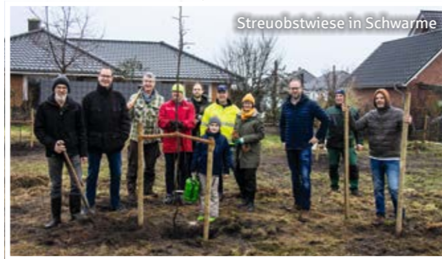
Streuobstwiese in Schwarme