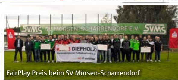
FairPlay Preis beim SV Mörsen-Scharrendorf