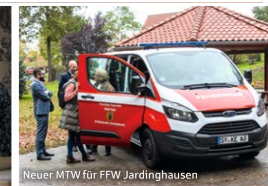
Neuer MTW für FFW Jardinghausen