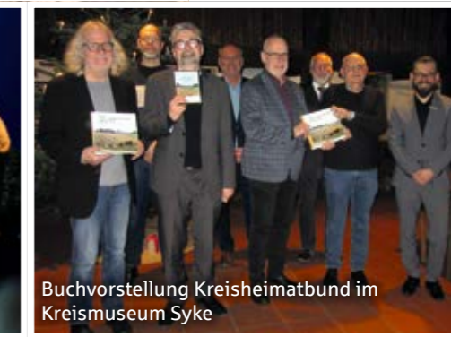
Buchvorstellung Kreisheimatbund im Kreismuseum Syke