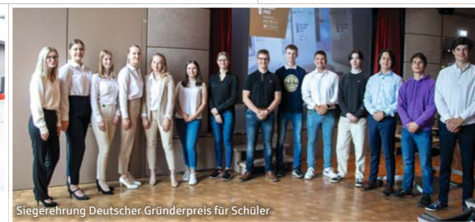
Siegerehrung Deutscher Gründerpreis für Schüler