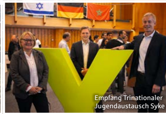
Empfang Trinationaler Jugendaustausch Syke