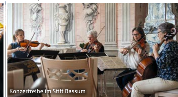
Konzertreihe im Stift Bassum