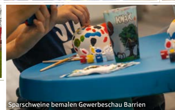
Sparschweine bemalen Gewerbeschau Barrien