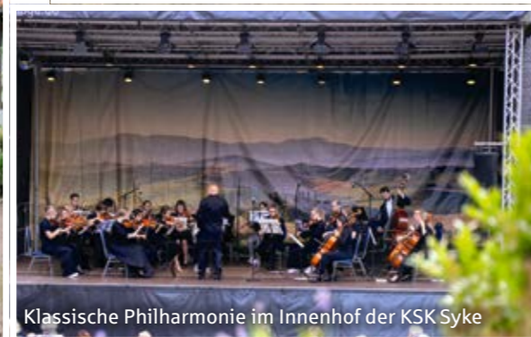
Klassische Philharmonie im Innenhof der KSK Syke