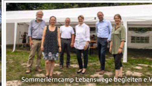
Sommerlerncamp Lebenswege begleiten e.V.