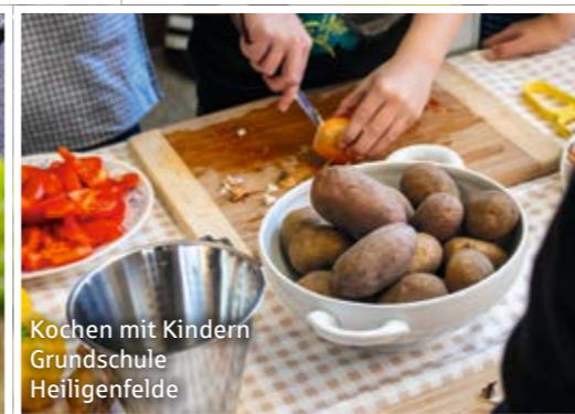
Kochen mit Kindern Grundschule Heiligenfelde