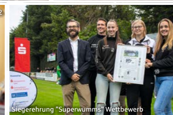
Siegerehrung "Superwumms" Wettbewerb