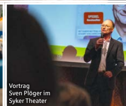
Vortrag Sven Plöger im Syker Theater