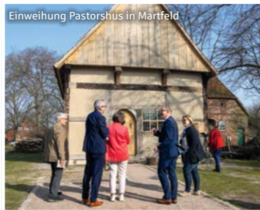
Einweihung Pastorshus in Martfeld

Ob groß oder klein, historisch oder kulturell, musikalisch oder pädagogisch: In 2022 konnten wieder viele Projekte angeschoben und abgeschlossen werden, die gut für die Menschen und die Region sind. Bei vielen davon spielt die Sparkasse eine wichtige Rolle als Unterstützer und Förderer - einige davon können Sie auf diesen Seiten entdecken.