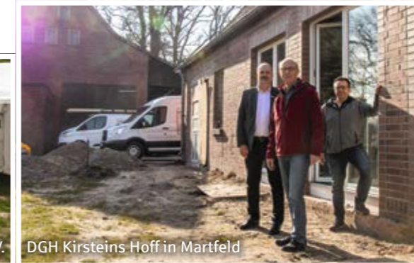
DGH Kirsteins Hoff in Martfeld